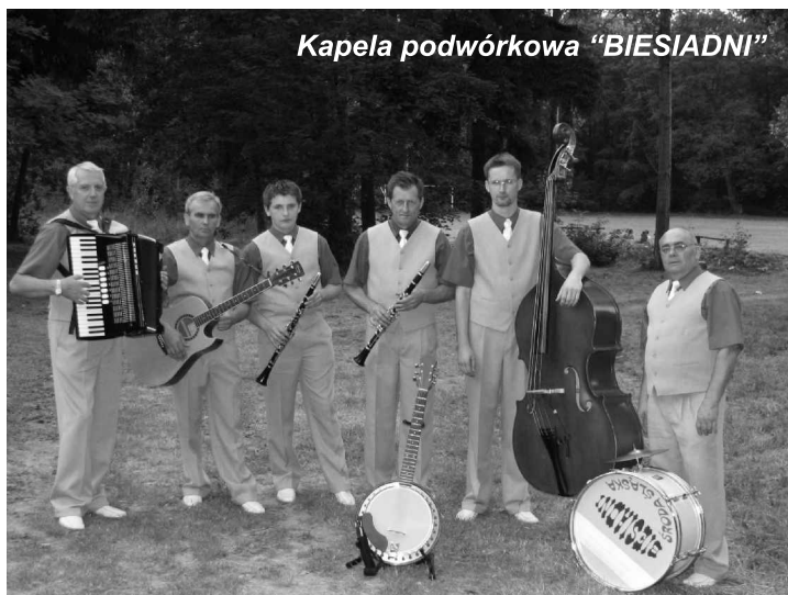
Kapela podwórkowa „BIESIADNI”

Najstarszą kapelą ludową w naszej Gminie są „Dolnoślązacy”. Obecnie w skład kapeli wchodzi 14 osób. Zespół rozpoczął swoją działalność w 1976 r. W swojej twórczości nawiązują do tradycji Dolnego Śląska, upowszechniając ją na licznych festiwalach poświęconych krzewieniu kultury ludowej. „Dolnoślązacy” występowali m.in. na Ogólnopolskim Festiwalu Kapel w Kazimierzu nad Wisłą, koncertowali również w Niemczech, Czechach i na Litwie. W 2004 r. nagrali płytę w Polskim Radiu Wrocław. Stałe miejsce w harmonogramie artystycznym zespołu zajmuje uczestnictwo w Przeglądzie Zespołów Folklorystycznych w Sobótce pn. „Pod Słężą Śpiewanie”. Zespół bierze również udział w wielu uroczystościach patriotycznych odbywających się na terenie gminy. W 1997 r. „Dolnoślązacy” otrzymali nagrodę Ministra Kultury za całokształt pracy artystycznej. W 2007 r. Rada Miejska w Środzie Śląskiej uhonorowała zespół Medalem „Zasłużony dla Gminy Środa Śląska”.