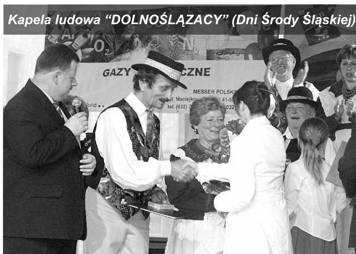
Kapela ludowa „DOLNOŚLĄZACY” (Dni Środy Śląskiej)