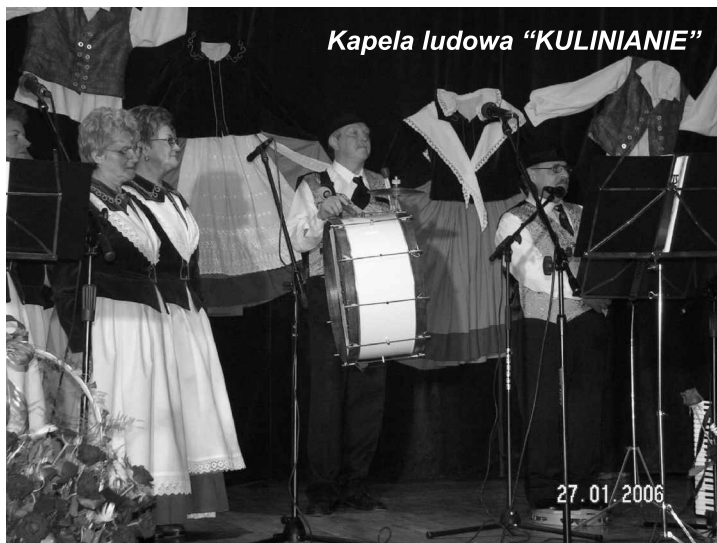
Kapela ludowa „KULINIANIE”